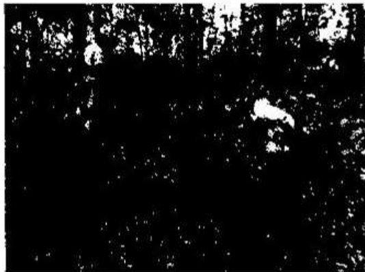
Foto 11. Imagen del acceso al sitio arqueológico Paxte previo a la realización de la documentación y relleno de los saqueos existentes