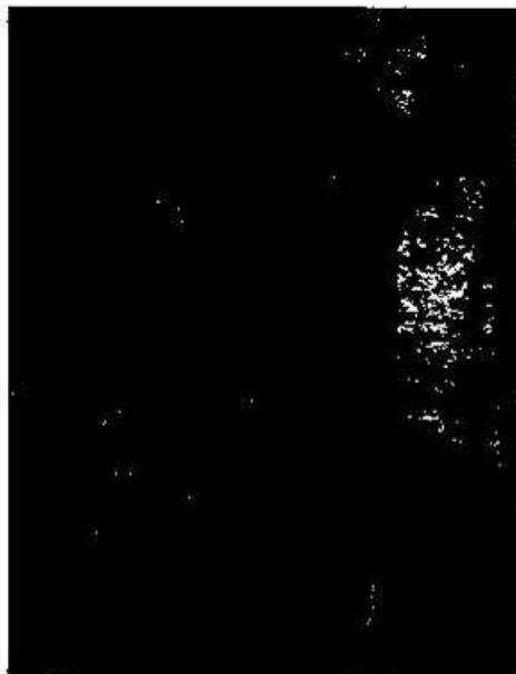
Foto 12. La Estela 5 de Yaxha es una de las cuatro que se ha considerado trasladar a su ubicación final