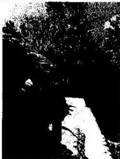
Foto 5. Durante la visita se pudo efectuar un monitoreo del área en torno de Naranjo, entre otros aspectos