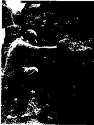
Foto 9. La conservación de la importante arquitectura expuesta de Yaxha y Topoxte, ha sido debidamente incluida entre las diversas actividades a efectuar durante el año 2014