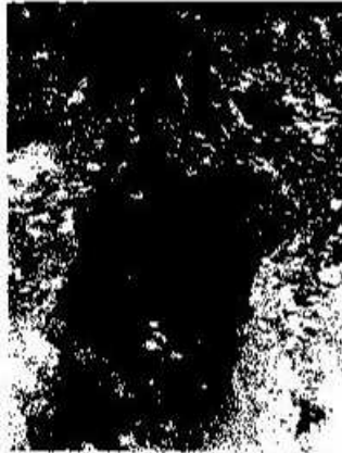
Foto 7. Ingreso a la excavación localizada en el Edificio U, Nakum previo a su relleno