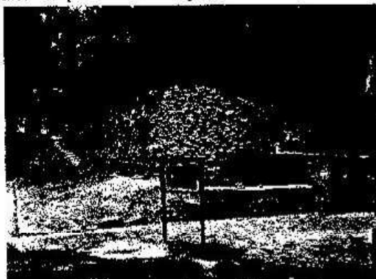
Foto 2. Esquina Noroeste del Edificio 395, luego de los trabajos de restitución de embono