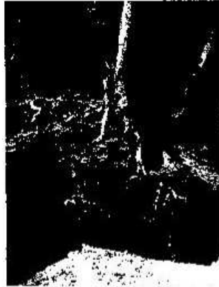
Foto 6. Presencia de árbol dispuesto sobre muro del Edificio I, Acrópolis Sur de Nakum