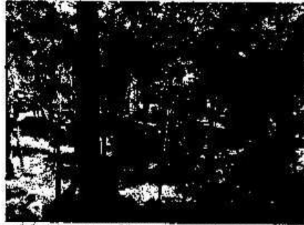
Foto 8. Vista de una de las plazas del sitio arqueológico Naranjito luego de los trabajos de chapeo y limpieza