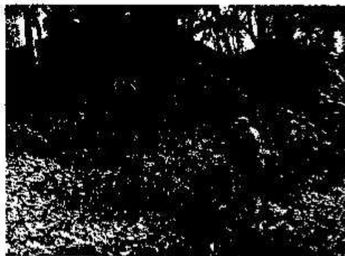
Foto 4. Personal del Grupo de Mantenimiento del Parque mientras removían las ramas que habían sido previamente podadas