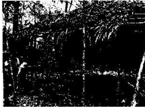
Foto 10. Uno de los aspectos en los que se trabajó y es necesario proponer, consiste en el fortalecimiento de las actividades de monitoreo y conservación de los sitios arqueológicos intermedios y menores del Parque Nacional Yaxha-Nakum-Naranjo