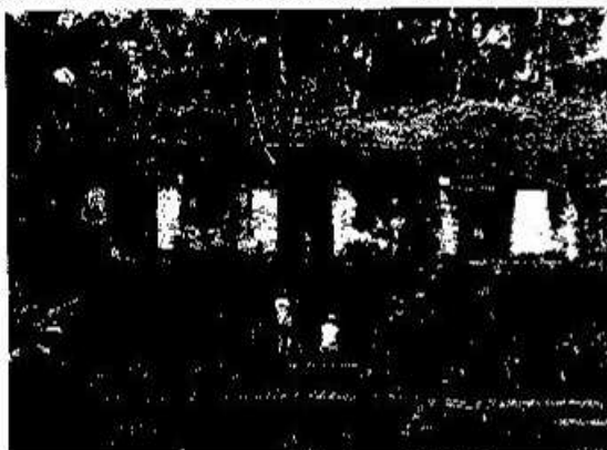
Foto 3. En la imagen se muestra el edificio 389 cuando era objeto de atención para la realización de trabajos de limpieza general, así como resanes y posterior trabajo en las cámaras tanto de este edificio como del 375, en el patio 4